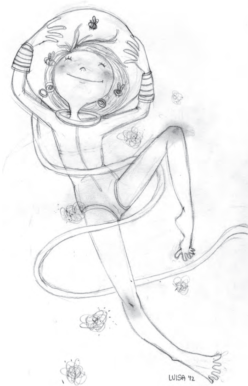
Illustrazione di Luisa Montalto

Lisa sta studiando storia contemporanea, ha appena fatto un seminario sullo sterminio nazista. Ieri è tornata a casa da una lezione e mi ha detto che si sente come gli ebrei, solo che non ha una nazione in cui rifugiarsi, un posto sicuro in cui scappare. Chissà che fine faranno quelli che stanno pagando una fortuna per salire sulle navi spaziali. Le ho detto di provare almeno a passare il test di ammissione, ma dice che di andare non si sa su quale galassia sperduta a morire, dopo anni e anni di viaggi nel nulla passati a bere piscio rigenerato non ci pensa proprio. Meglio qui, tutti insieme. Vitime e carnefici al contempo, per non aver voluto vedere che il salone da ballo era incrinato, cinque minuti prima che il Titanic andasse giù.