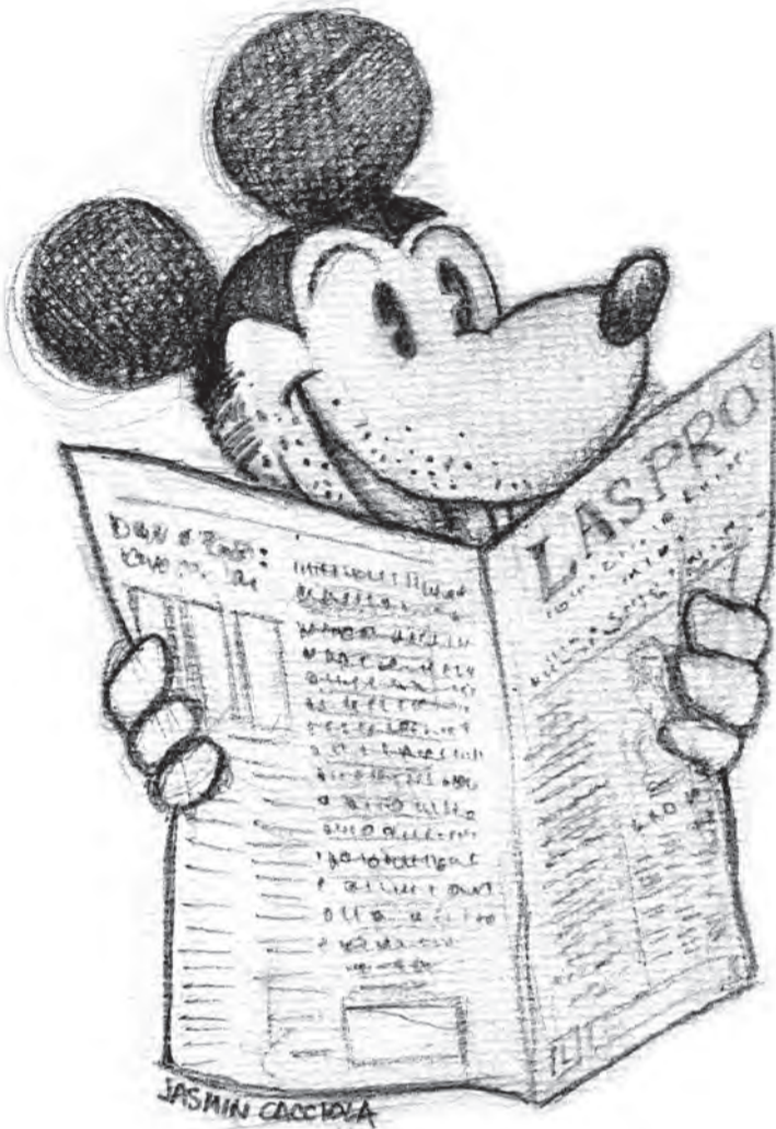
Illustrazione di Jasmine Cacciola

Complici, complici per necessità, ecco il paradosso! Allora capite bene che valore ha togliersi il sonno, perché ormai di questo si tratta, per portare avanti un progetto ambizioso come Laspro ?