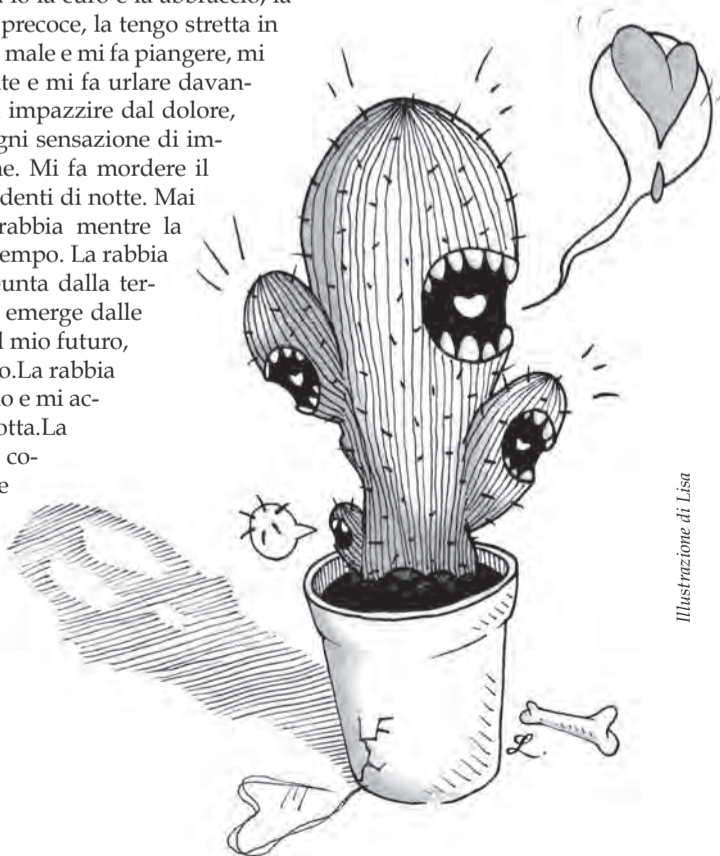
Illustrazione di Lisa