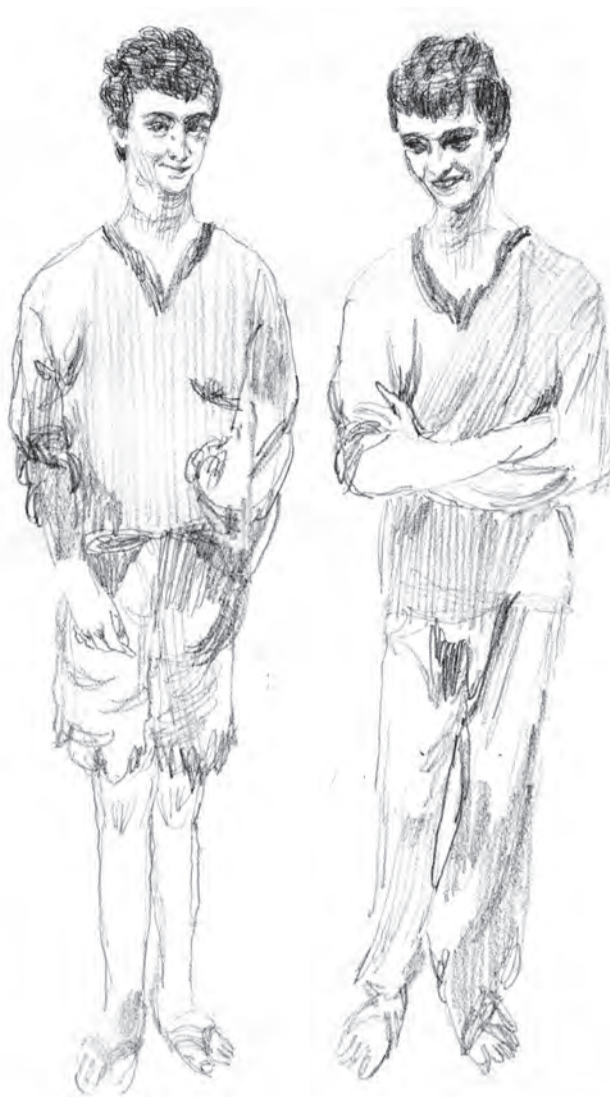
Illustrazione di Marta Mancini

Pasquale è riuscito a scansarsi ma solo dopo essersi preso due